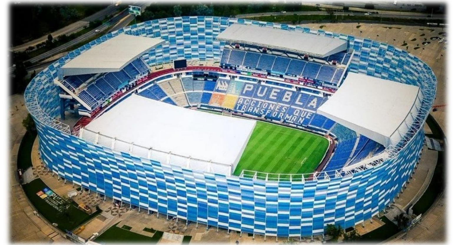
MUNDIAL DE CLUBES PUEBLA 2023

EI PRIMER LUGAR DE LA COPA DE ORO CLASIFICARÁ AL TORNEO NACIONAL ANF7 2024