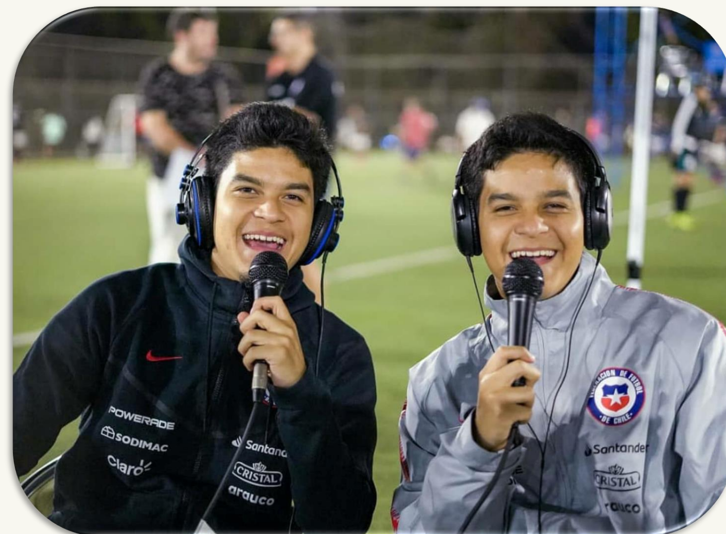
TRANSMISIÓN PROFESIONAL DE LAS FINALES