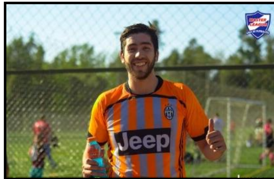
Jugador del Partido