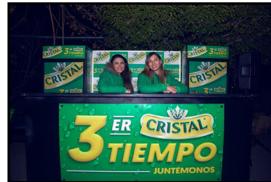
Activaciones 3T Cristal